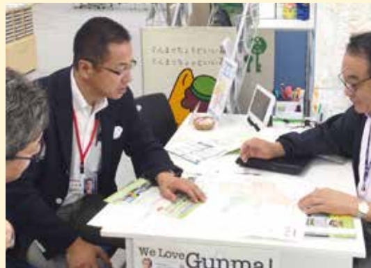
ぐんま暮らし支援センターにて、移住の取組みを伺う