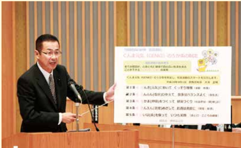
健康寿命の延伸について、パネルを使用し知事に質問を行う