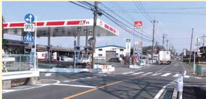
名和小学校付近の通行規制。西から東へ向って午前7時～8時は右折が出来ないように。