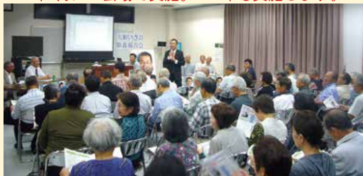
昨年5月に行った県政報告会 山王町会場の様子