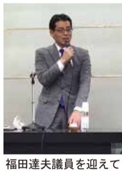
福田達夫議員を迎えて

また、自民党群馬県連では、福田達夫衆議院議員(党総務会長)を講師に迎えて時局講演会や、河野太郎衆議院議員(党広報部長)を講師に迎え「SNS活用について」アドバイスを頂きました。