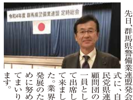
先日、群馬県警備業連盟発会式に、自